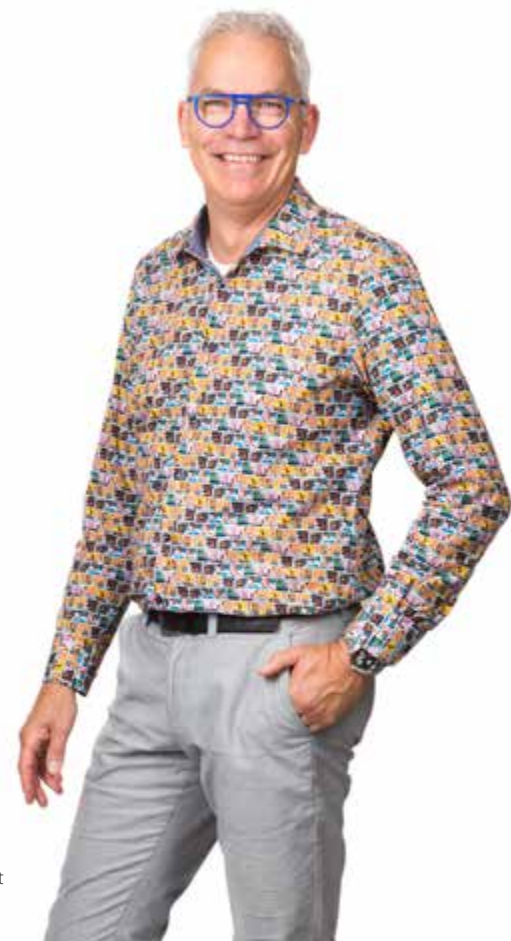
Lex Klein Schiphorst Opticien, optometrist en contactlensspecialist